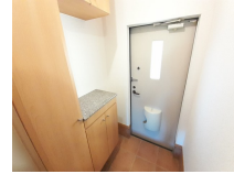
その他部屋・スペース