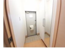
その他部屋・スペース