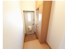
その他部屋・スペース