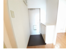
その他部屋・スペース