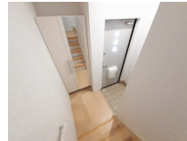
その他部屋・スペース