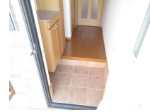
その他部屋・スペース